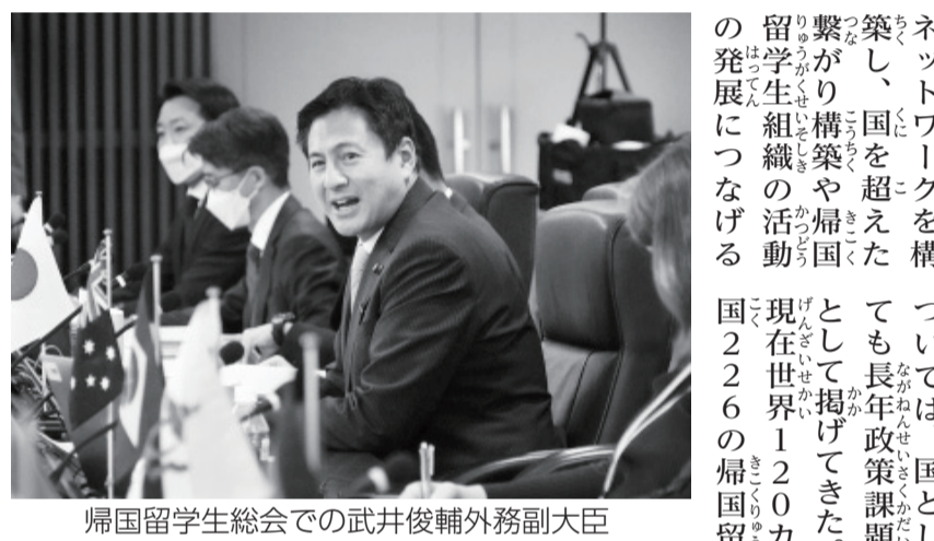
帰国留学生総会での武井俊輔副外務大臣

教育未来創造会議 第二次提言に向けた論点整理(案)から一部抜粋 (アウトカム)に着眼して、受け入れの質の向上を図る視座を転換する必要がある。具体的には、学生の卒業後の活躍に向けて、環境整備や就職支援など、受け入れ企業側の在留資格改善の取り組みが求められる。