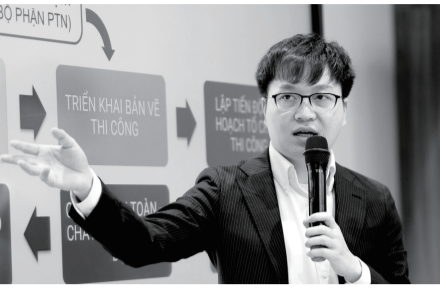
トウイさん ベトナム出身 ホーチミン市工科大学建設工学専攻卒業

があり、自分が論文で書いていた地盤の分野で、TNF工法という素晴らしい技術があり、それを世界に広めたいという社長のビジョンを知り、この会社で働いてみたいと思いました。自分が高い技術を学んで、ベトナムに持って帰れたら良いなと考えたからで