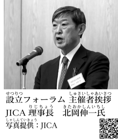
JICA 理事長 北岡伸一氏

国際協力機構(JICA)と一般社団法人「グローバリゼーション・フォーラム」が11月18日、責任ある外国人労働者受入れプラットフォームを設立した。このプラットフォームは、責任ある外国人労働者の受入れを促進し、労働者の権利を保護することを目的としている。